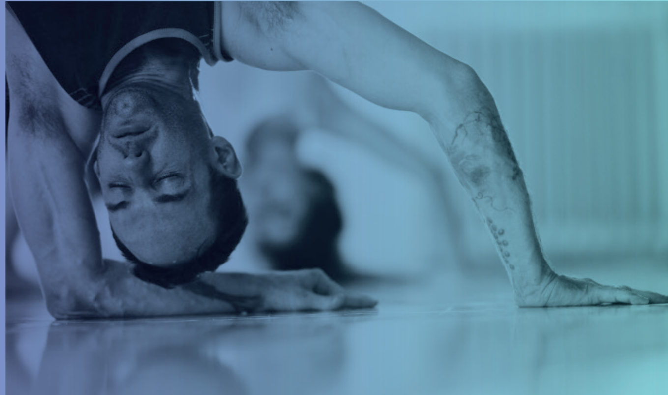
„Munich DancePAT“ von Ray Demski