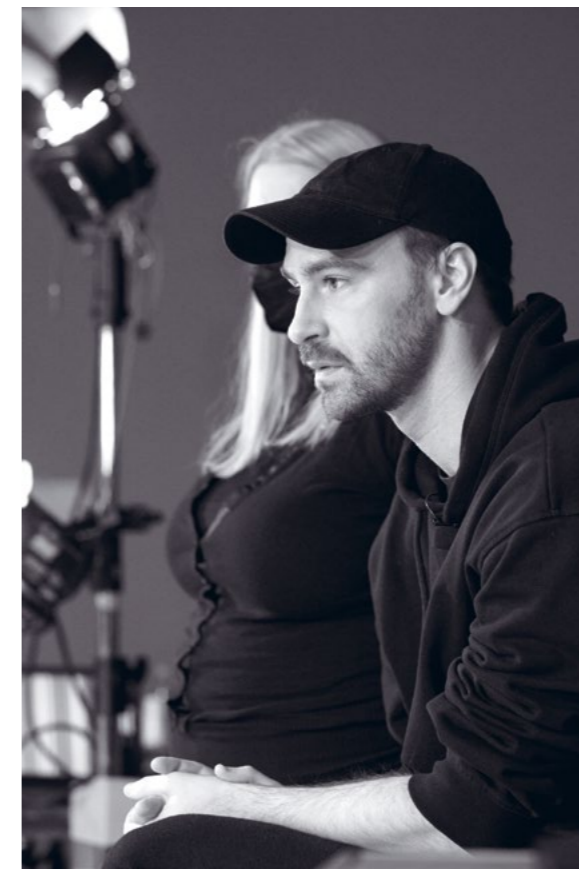
@ Marie Gryzka / rue nouvelle